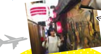
なんやかんや言ってみんな仲良し